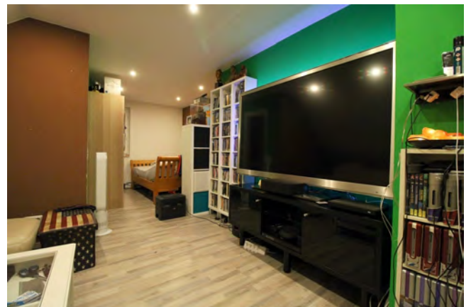
Zimmer im Dachgeschoss