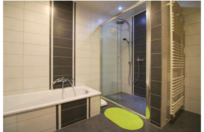
Mit Badewanne und Dusche